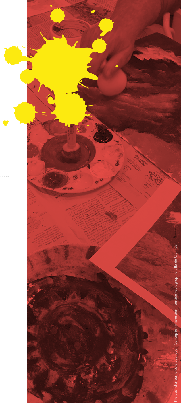
Ne pas jeter sur la voie publique - Conception-impression : service reprographie ville de Quimper